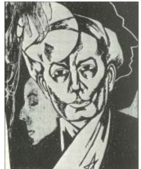
Holzchnitt von Christian Schaad

Freiheit eröffnet und beschließt die Welt. (422)