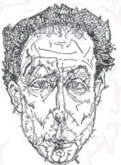
Porträtzeichnung von Max Oppenheimer

Gesundheit ist ansteckender als Krankheit. Wäre das Innerste nicht heil, so wäre der Leib schon die Pest selber. Die geflissentliche Kultivierung dieser Gesundheit des Willens muss schliesslich alle Krankheit überwinden, ja, den Tod zum Mär-