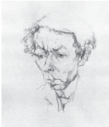
Porträt von Ludwig Meidner

... Um Welt und Schicksal zur eigensten Schöpfung zu machen, muss man sich auf sich selber