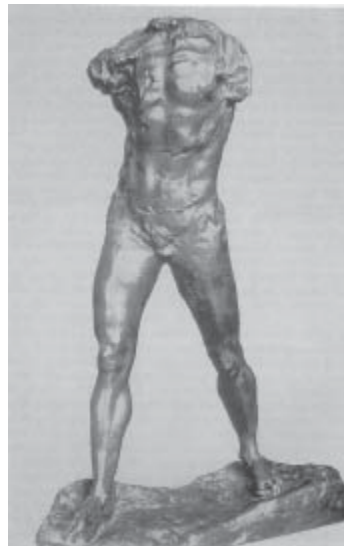
Abb. 9: Auguste Rodin, Der schreitende Mann („Man hat mir oft vorgeworfen, dass mein Schreitender keinen Kopf hätte. Braucht man denn zum Gehen einen Kopf?“)

In der Kunst- und Literaturgeschichte lässt sich eine Entwicklung beschreiben, die von der Perspektive, in der Fragmente ganz am Ideal der vollständigen Ganzheit gemessen und dementsprechend als defizitär angesehen wurden, hin zu einer Sichtweise führt, in der das Fragmentarische immer mehr Eigenständigkeit bekommen hat. (Abb. 9)