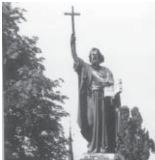
Bonifatius-Denkmal in Fulda (Abb. 1)

Solche Entwicklungen haben offensichtlich damals dazu gedient und dienen heute noch dazu, Machtzuwachs herzustellen; damals: angesichts realer Ohnmachtserfahrungen im allmächtig erscheinenden Römischen Imperium mit der Allmacht Gottes ein Gegengewicht zu schaffen und damit zugleich menschliche Ohnmacht zu transzendieren; später immer mehr: die Macht der Kirche zu untermauern. (Abb. 1)