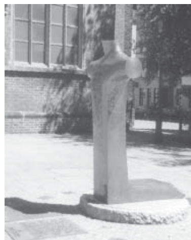
Abb. 8: Dietrich-Bonhoeffer-Denkmal in Breslau

Von hier aus sind es nur noch wenige Schritte bis zur Gesundheits- und Sozialpolitik der Nationalsozialisten, deren Idee, dass Ganzheit, dass heile Menschen, ein heiles Volk erstrebenswert und herstellbar sei, damals zu komplizierten diagnostisch-therapeutischen Programmen führte, mit der bekannten therapeutischen Stufenleiter „Erziehung – Arbeit – medizinische Behandlung – Eliminierung“. E. Bloch hat auf diesem Hintergrund das Wort „Ganzheit“ als Naziwort gebrandmarkt, und dieser Ein-