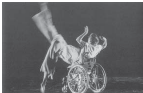
Abb. 11: Tanzkompanie „HandiCapache“